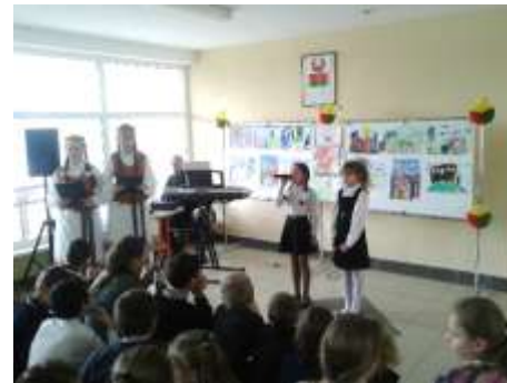
Kovo 11-osios renginio akimirka